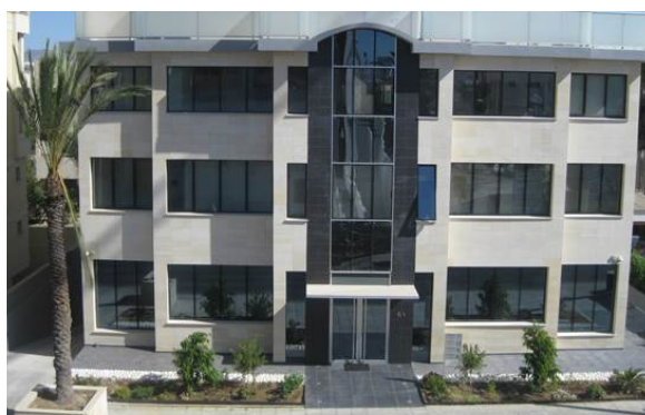
ΙΔΙΟΚΤΗΤΑ ΓΡΑΦΕΙΑ ΤΗΣ ΕΤΑΙΡΕΙΑΣ